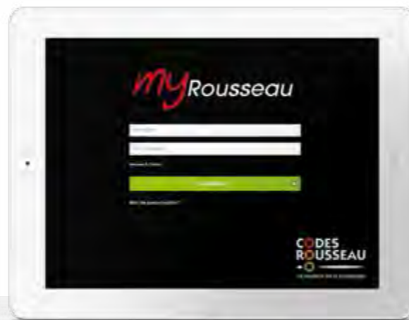
Visuels du mini-pc, de la télécommande et de la tablette non contractuels