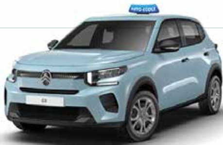
C3 100 ch BVM6 (moteur thermique) : 279 € HT/mois

Dans le cadre du partenariat Club Rousseau & Stellantis, vous pouvez profiter de tarifs très compétitifs sur la Citroën C3, la Peugeot 208 et l'Opel Corsa.