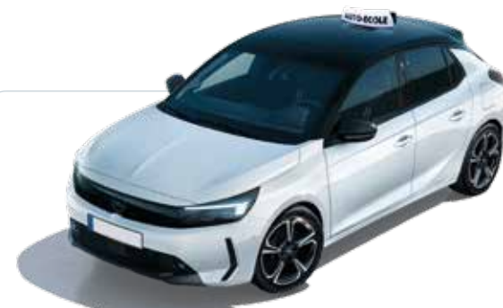
OPEL CORSA GS 1.2T 100 ch BVM6 (moteur thermique) : 294 € HT/mois