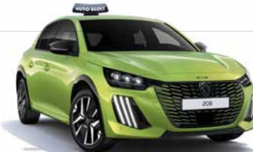
208 Allure 100 ch BVM (moteur thermique) : 371 € HT/mois